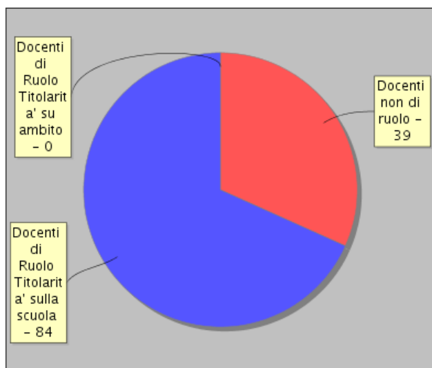
Distribuzione dei docenti per tipologia di contratto